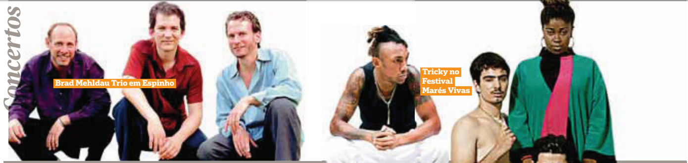
Brad Mehldau Trio em Espinho