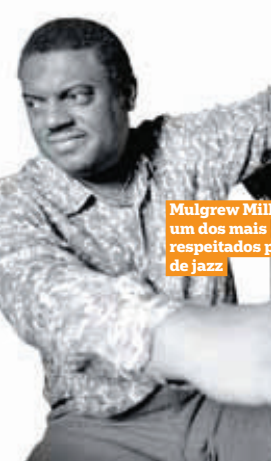
Mulgrew Miller, um dos mais respeitados pianistas de jazz