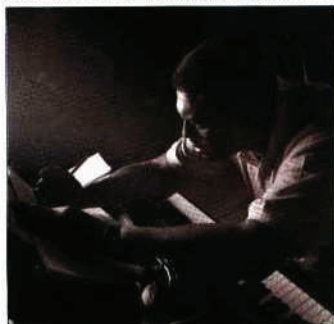
Mulgrew Miller vem a Lisboa no Verão

O jazz vai marcar o tom deste Verão no Centro Cultural de Belém. Pela primeira vez, a cidade recebe o Lisbon Jazz Summer School , um curso intensivo de jazz de nível médio e avançado, no qual a formação dos participantes se faz através do convívio de perto com a dinâmica de um sexteto de jazz reconhecido internacionalmente.